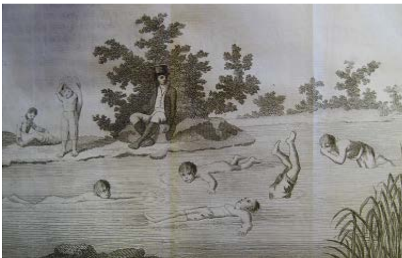
Imagen 3. Lámina La gimnástica o escuela de la juventud (1807)

Uno de los modos de nadar más antiguos y más simples es con las manos juntas, los pulgares y dedos sobre el agua, acercándolos y retirándolos sucesivamente del pecho [...] Se ha de cuidar también de que el movimiento de las manos convenga con el de los pies: acercándolas a la barba, llevándolas en seguida hacia delante formando un semicírculo a izquierda y a derecha, volviendo la palma de la mano hacia fuera. En cuanto a los pies, se acercan muy unidos, luego se extienden sacudiendo el agua a izquierda y derecha. (Amar y Jauffret, 1807, pp. 150-151)