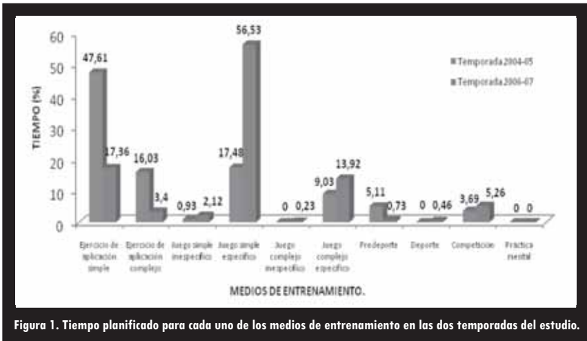
Figura 1. Tiempo planificado para cada uno de los medios de entrenamiento en las dos temporadas del estudio.

En la Figura 1 se muestran los valores de las categorías correspondientes a cada uno de los medios empleados por el entrenador en las dos temporadas analizadas. Se puede observar que el ejercicio de aplicación simple (EAS) es el medio de entrenamiento más empleado durante la primera temporada, mientras que el juego simple específico (JSE) es el dominante en la segunda. Existen diferencias estadísticamente significativas entre ambas temporadas en la variable medios de entrenamiento ( Z = -10.615 ; p < .01 ). Existen diferencias estadísticamente significativas en el empleo de los ejercicios de aplicación simple ( Z = -10.228 ; p < .01 ), ejercicios de aplicación complejos ( Z = -4.899 ; p < .01 ), juegos simples específicos ( Z = -11.348 ; p < .01 ) y en los juegos complejos específicos ( Z = -2.286 ; p < .05 ) entre la temporada 2004-05 y 2006-07.